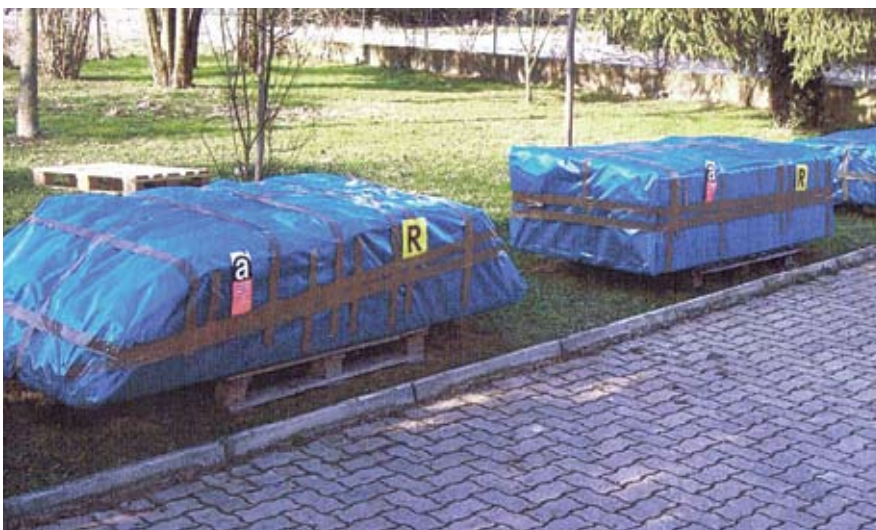
Esempio di lastre correttamente imballate

Quando è stata accertata la sua elevata cancerogenicità ne è stato vietato l'uso (legge 257 del 1992). Nel territorio sono però ancora presenti molti fabbricati antecedenti il '92 che contengono amianto. Lo si trova nei rivestimenti di facciate, pareti e pavimenti, tetti, lastre per solette, isolazioni di tubazioni, dietro le installazioni elettriche, nei fornelli elettrici e nelle fioriere. ✿