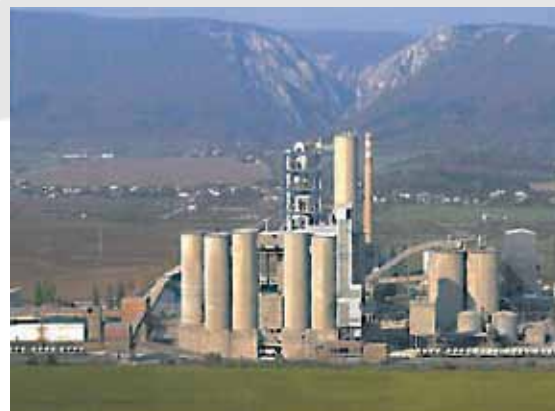
stabilimento cementiero a Turňa - Slovacchia