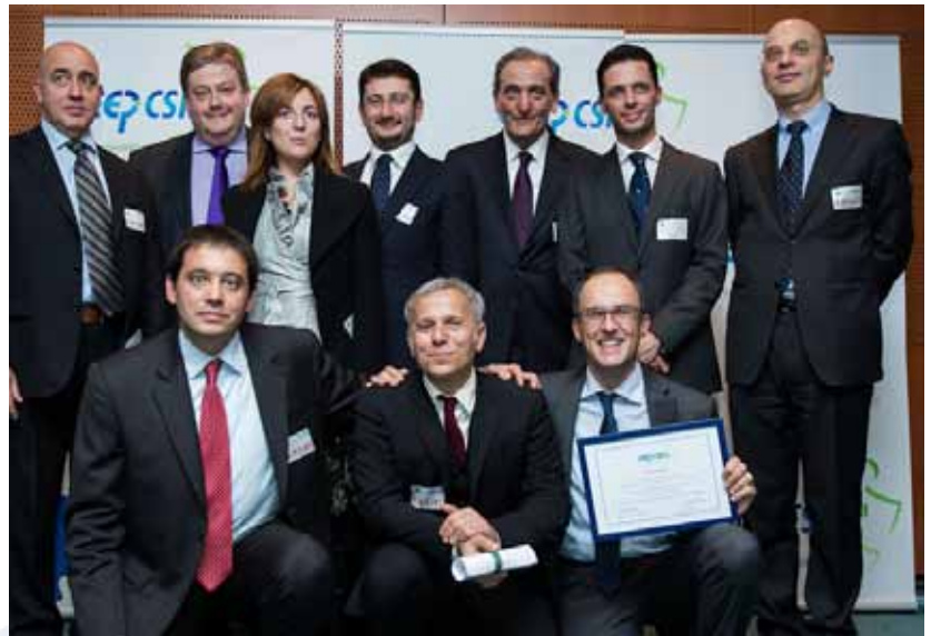
Bruxelles: foto di gruppo delle aziende italiane premiate