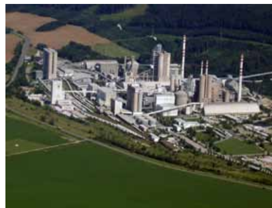
stabilimento cementiero di Rohožník - Slovacchia