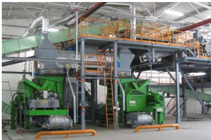
particolare degli impianti dello stabilimento di Pezinok - Slovacchia